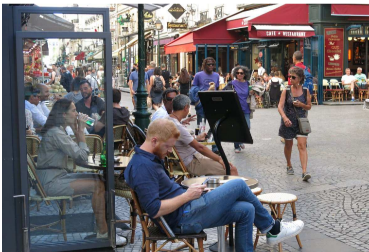
Rue Montorgueil (11 e ), fin août. Surtout lorsqu'il fait beau, les terrasses permettent aux cafetiers d'augmenter leur chiffre d'affaires, même avec des contraventions. (LP/B.H.)